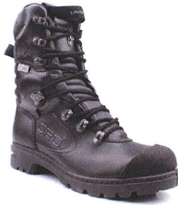
FENIX BLACK 2.1

Grupo 513 categoría de protección: S3 AN CI WR HRO SRA; F2A HI3