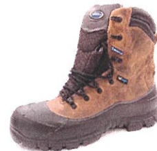
EXPLORATION HIGH BROWN