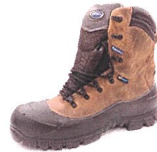
EXPLORATION HIGH BROWN