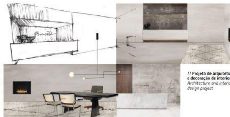
// Projeto de arquitetura e decoração de interiores Architecture and interior design project

Outreached, the final result (hopefully) is a well-balanced compromise between the parties, where intimate comfort, pursued after a soul definition, is connected to the hotel functionality and concept, offering a new experience, a new "discovery". "Every day is a New Discovery".