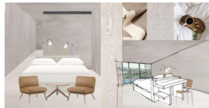
// Projeto de arquitetura e decoração de interiores Architecture and interior design project