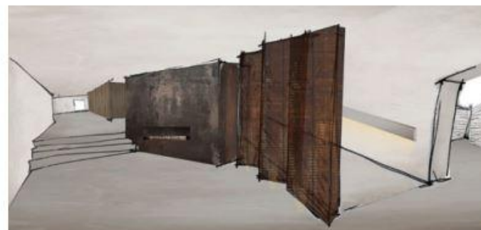
// Projeto de arquitetura e decoração de interiores Architecture and interior design project