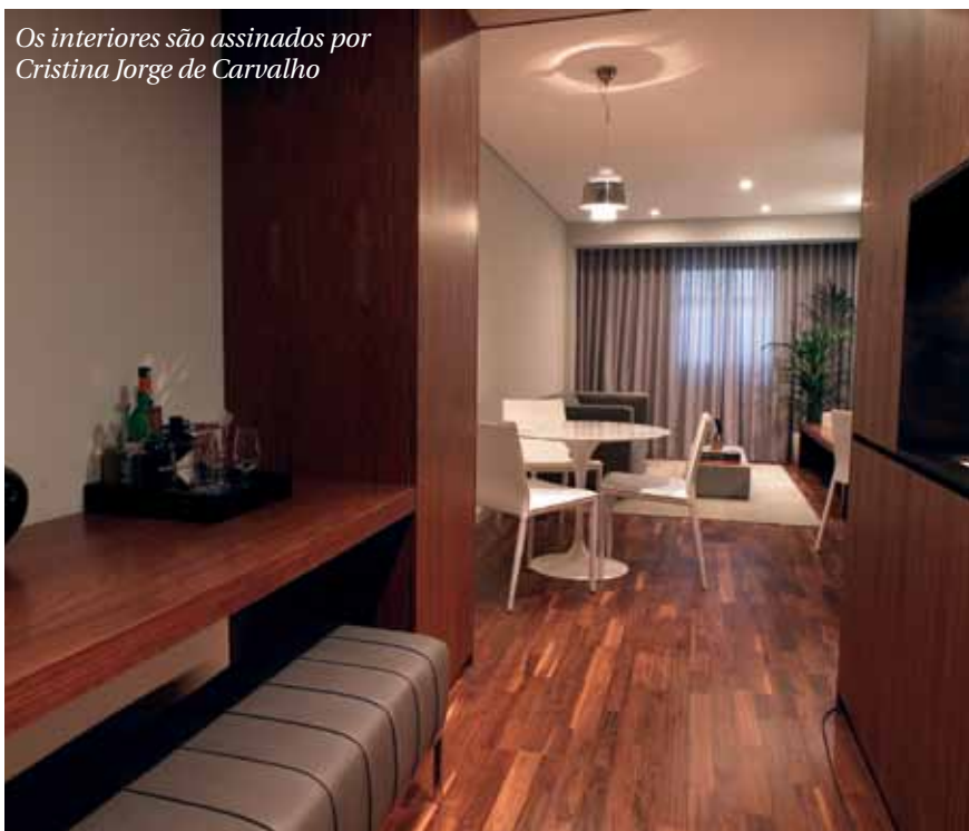
Os interiores são assinados por Cristina Jorge de Carvalho