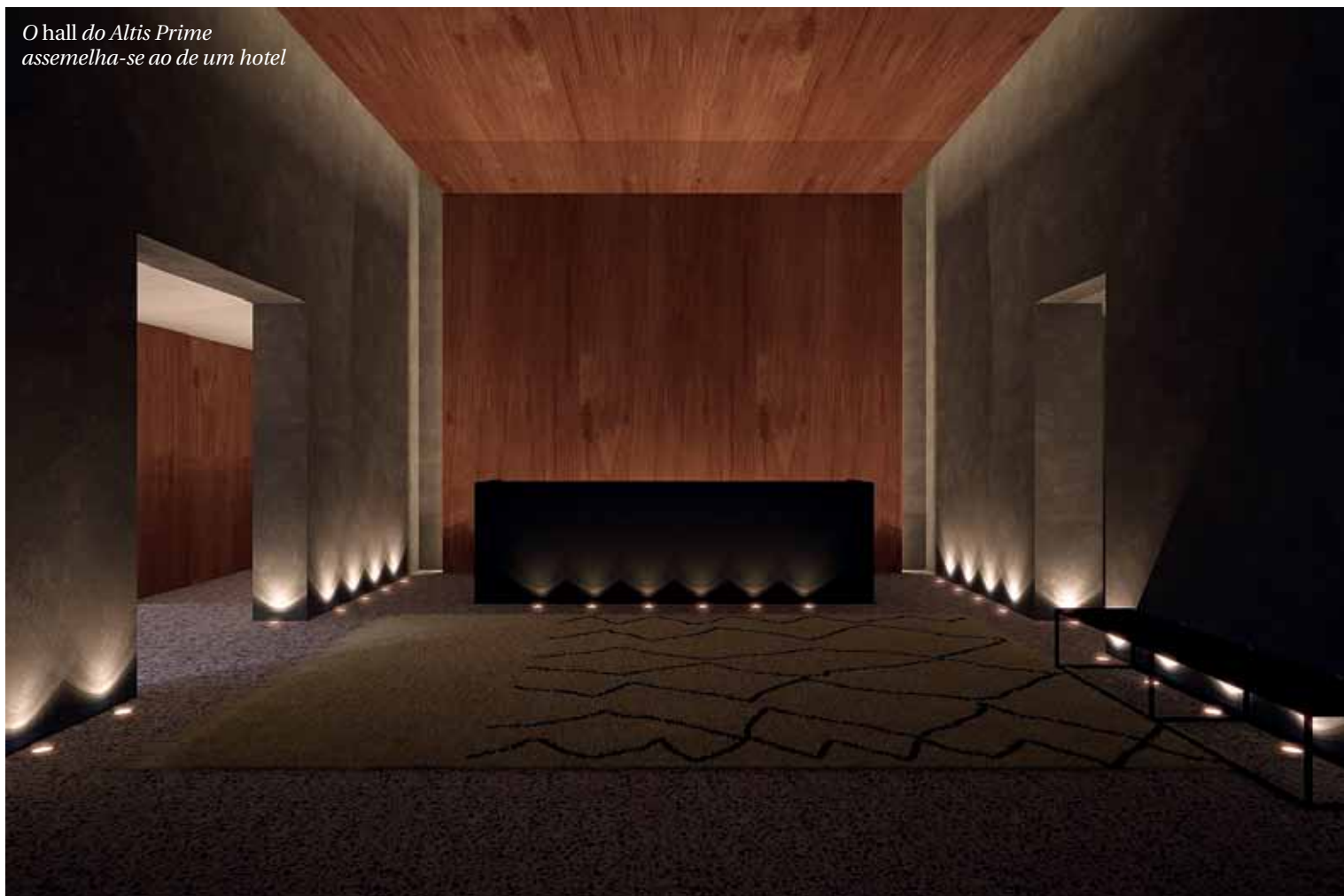
O hall do Altis Prime assemelha-se ao de um hotel

edifício tem uma parede dupla para isolamento térmico, as amplas janelas possuem caixilharias com vidros duplos e o ar condicionado é individual. “As salas e os quartos estão revestidos com soalho de nogueira americana, e as cozinhas estão totalmente equipadas”, descreve o director-geral do Hotel Altis e Altis Suites. Os apartamentos estão ainda dotados de televisores LCD e mobilados. O projecto de design de interiores assinado por Cristina Jorge de Carvalho, que já realizou intervenções tanto em hotelaria como em empreendi-