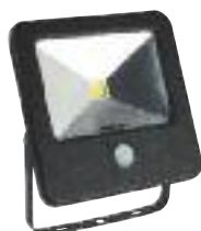
20W apparecchi alogeni da 120 W