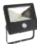
10W apparecchi alogeni da 80 W