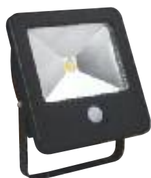
50W apparecchi alogeni da 230 W