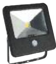
30W apparecchi alogeni da 160 W