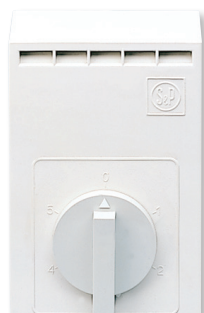
LxAxH (mm): 90 x 54 x 134