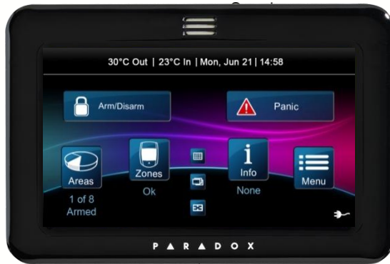
TM50 Touch Home Screen

O touchscreen intuitivo TM50 permite controlar as funções do sistema Paradox através da sua interface táctil.