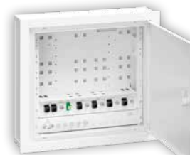
Solução ATI_RACK tipo PCS - 400x375