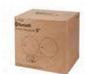
Medidas pack y peso: 24,5 x 22 x 19 cm. 2,133 gm.

Kit receptor de audio que permite el emparejamiento con cualquier dispositivo Bluetooth® . Se integra con los mecanismos eléctricos 45 x 45 más populares del mercado. Alcance de señal de 10/12 metros Diseñado para garantizar seguridad y evitar la interferencia de otros usuarios cercanos identificando cada uno con su propio código. Entrada auxiliar de Jack 3,5mm para conectar fuentes externas de audio. Limitador de control de volumen y opción Mono/Estéreo para programar en el momento de la instalación.