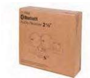
Medidas pack y peso: 24,5 x 22 x 6,5 cm. 0,838 gm.

Kit receptor de audio que permite el emparejamiento con cualquier dispositivo Bluetooth® . Se integra con los mecanismos eléctricos 45 x 45 más populares del mercado. Alcance de señal de 10/12 metros Diseñado para garantizar seguridad y evitar la interferencia de otros usuarios cercanos identificando cada uno con su propio código. Entrada auxiliar de Jack 3,5mm para conectar fuentes externas de audio. Limitador de control de volumen y opción Mono/Estéreo para programar en el momento de la instalación.