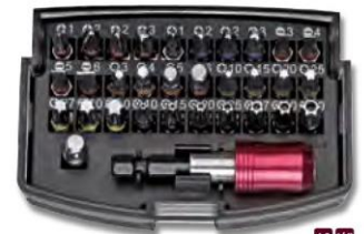
543 Schraubendreher-Bit-Satz Screwdriver Bit Set

Chrom-Vanadium Stahl verchromt, farbcodiert in schlagfester Kunststoffbox 32-tlg.