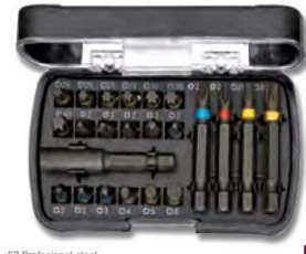
547 Kraft-Schraubendreher-Bit-Satz Impact Screwdriver Bit Set

52-Profi-Stahl schwarz in schlagfester Kunststoffbox 23-tlg. Magnet-Halter 54 mm mit C-Clip Bit für PH-Schrauben 2xPH1+2xPH2+1xPH3 x 25 mm Bit für PZ-Schrauben 2xPZ1+2xPZ2+1xPZ3 x 25 mm Bit für TORX®-Schrauben 1xTX10+1xTX15+2xTX20+2xTX25+1xTX30+1xTX40 x 25 mm Bit für PH-Schrauben, lange Ausführung 1xPH2 x 50 mm Bit für PH-Schrauben, lange Ausführung 1xPZ2 x 50 mm Bit für TORX®-Schrauben, lange Ausführung 1xTX20+1xTX25 x 50 mm