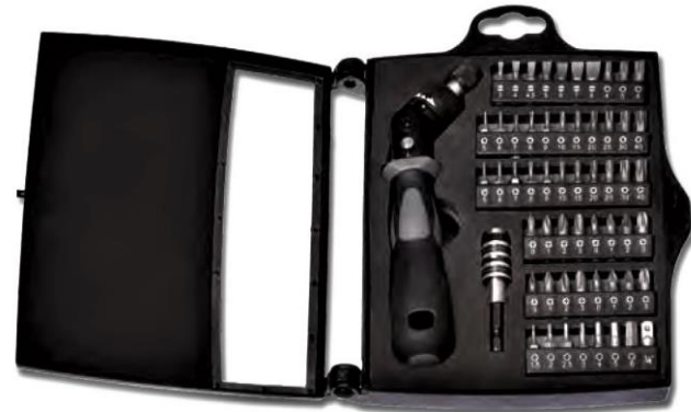
9130 Schraubendreher-Bit-Satz Screwdriver Bit Set

DIN ISO 1085, ISO 2318, ISO 10102 Chrom-Vanadium Stahl verchromt in schlagfester Kunststoffbox 58-tlg.