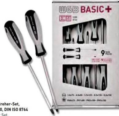
9587 Schraubendreher-Set, DIN ISO 2380, DIN ISO 8764 Screwdriver Set, DIN ISO 2380, DIN ISO 8764

Chrom-Vanadium Stahl verchromt mit schwarzer Spitze 2-Komponentenheft 9-tlg. im Sichkarton